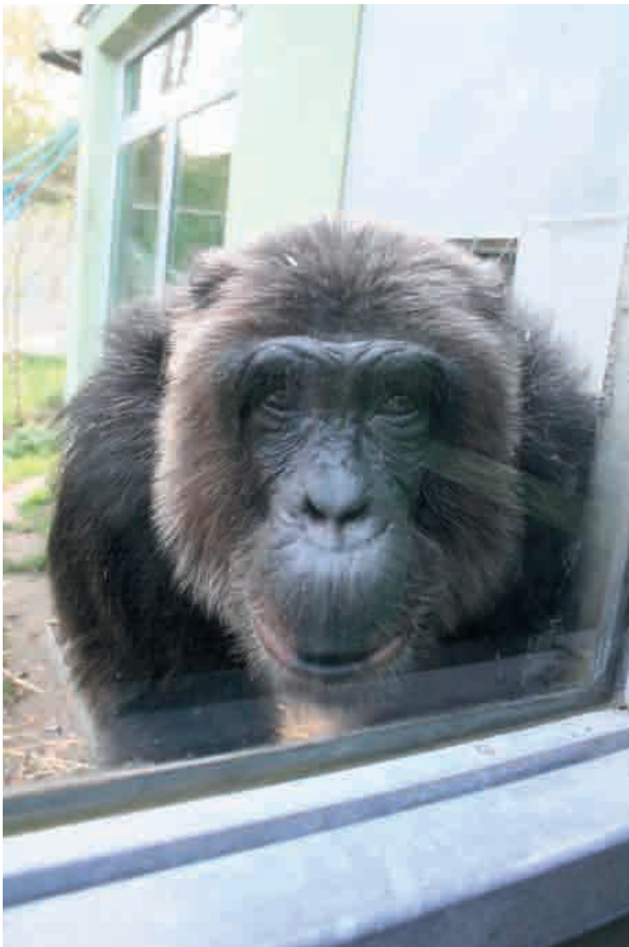
Wechselseitige Blicke auf uneresgleichen, getrennt durch eine Panzerglasscheibe

Eine ausführliche Liste der zitierten Literatur und Links finden Sie unter www.heurekablog.at