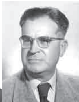
Otto Brunner: Historiker ohne Gedächtnis