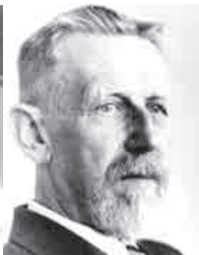
Eugen Fischer: Theoretiker des Rassenwahns ohne Reue