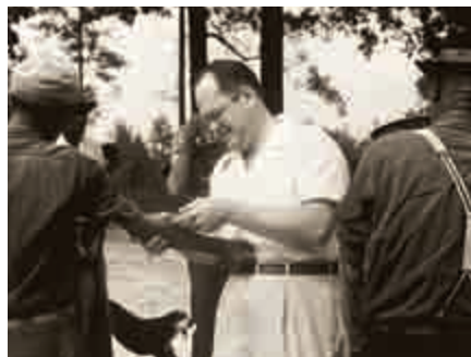
Tuskegee-Studie: Weißer Mediziner und sein „klinisches Material“

Syphilis. Von unverhohlenem Rassismus geprägte Forschung war keine Spezialität der NS-Wissenschaft. In der sogenannten Syphilisstudie von Tuskegee, einer