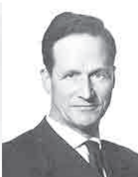
Werner Conze: „Umvölker“, Vordenker der Vernichtung