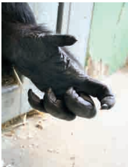
Auch nicht so anders: die Schimpansenhand