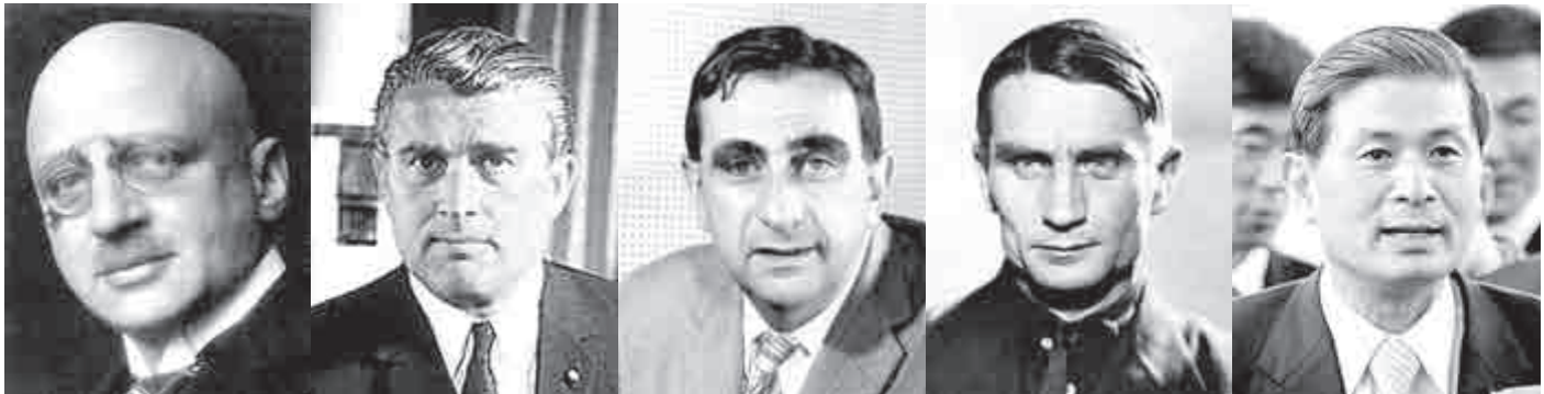
Fritz Haber: Erfinder und Propagandist des Gaskriegs

Ingenieur Skrupellos und Dr. Seltsam. Dass der Zweite Weltkrieg zur Entwicklung einer ganz neuen, noch destruktiveren Generation von Massenvernichtungswaffen geführt hatte, ging auf das Konto von skrupellosen Wissenschaftlern wie Wernher von Braun (1912–1977) und Edward Teller (1908–2003) . Von Braun diente sich jedem an, wenn er nur seine Raketen gen Himmel schießen konnte. Der Zweck – von Brauns eigentliches Interesse galt der bemannten Raumfahrt – heiligte bei ihm dabei jedes Mittel und jeden „Umweg“. Für Hitler baute er die V2-Rakete und nahm dabei den Tod tausender KZ-Häftlinge in Kauf. Auch nach 1945 verfolgte von Braun skrupellos weiter sein Ziel: den Bau einer militärisch nutzbaren Großrakete. Für seine Wahlheimat USA gewann von Braun den Wettlauf zum Mond, in der Hall of Shame gebührt ihm ein Ehrenplatz. Nicht weniger hemmungslos arbeitete der gebürtige Ungar Edward Teller in den USA an der mächtigsten Massenvernichtungswaffe aller