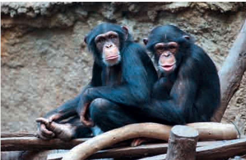
Max-Planck-Institut für Evolutionäre Anthropologie

Auch Schimpansen sind zu wechselseitigem Altruismus fähig