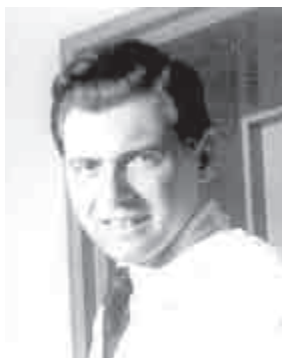
Josef Mengele: der Todesengel von Auschwitz